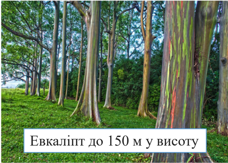
Евкалипт до 150 м у висоту

Квіткові різноманітні за розмірами, кольорами, формами. Представлені такими життєвими формам: трава, кущі, дерева.