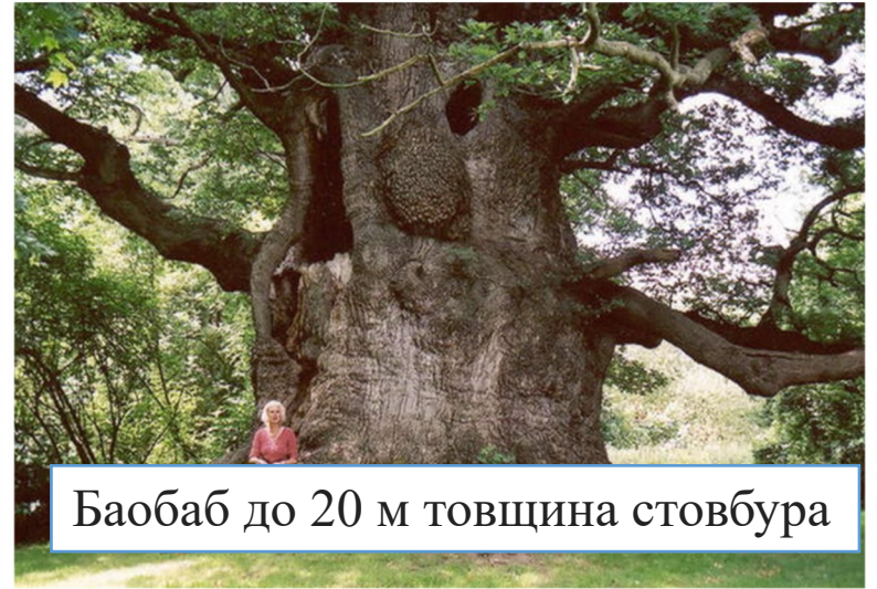
Баобаб до 20 м товщина стовбура