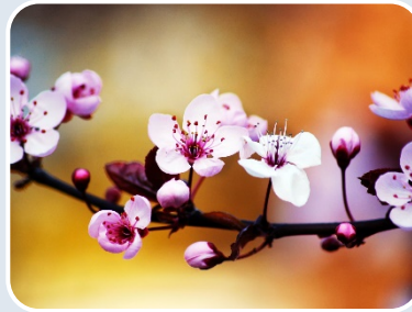
Клас Справжні Дводольні